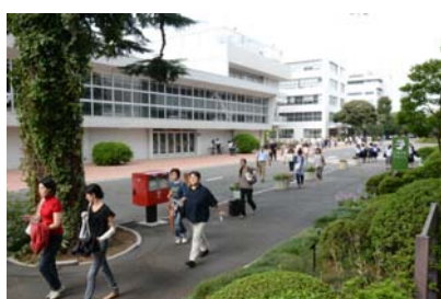
試験会場へ向かう受検者の方々