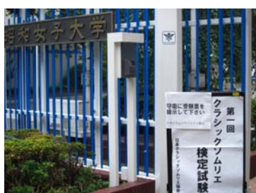
会場の昭和女子大学