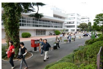
試験会場へ向かう受検者の方々