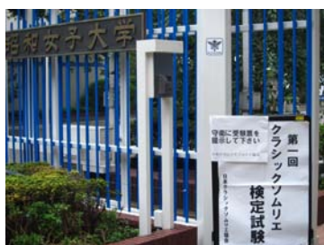
会場の昭和女子大学